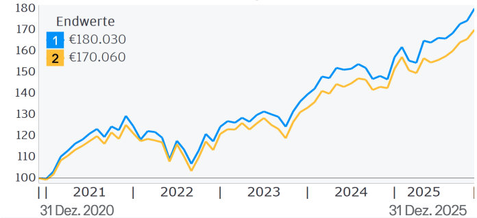
Fortlaufende 12-Monats-Wertentwicklung (%)